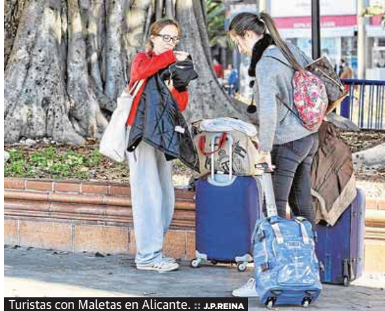
Turistas con Maletas en Alicante.

día después de la Encuesta de Gasto Turístico (Egatur). El estudio evidenció una de las asignaturas pendientes del turismo valenciano: la falta de rentabilidad. Este problema estructural se mantiene pese a que los turistas en la Comunitat gastaron un 3,11% más entre enero y noviembre.