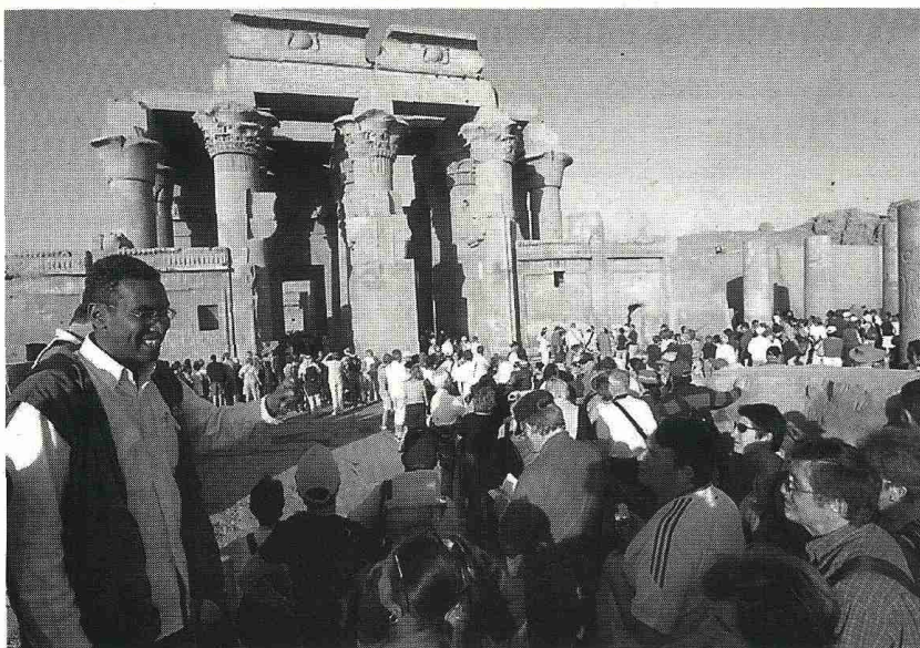
Visitas turísticas al templo de Kom Ombo, en Egipto.