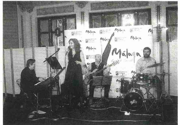
IMAGEN. El acto estuvo ambientado con música en directo.