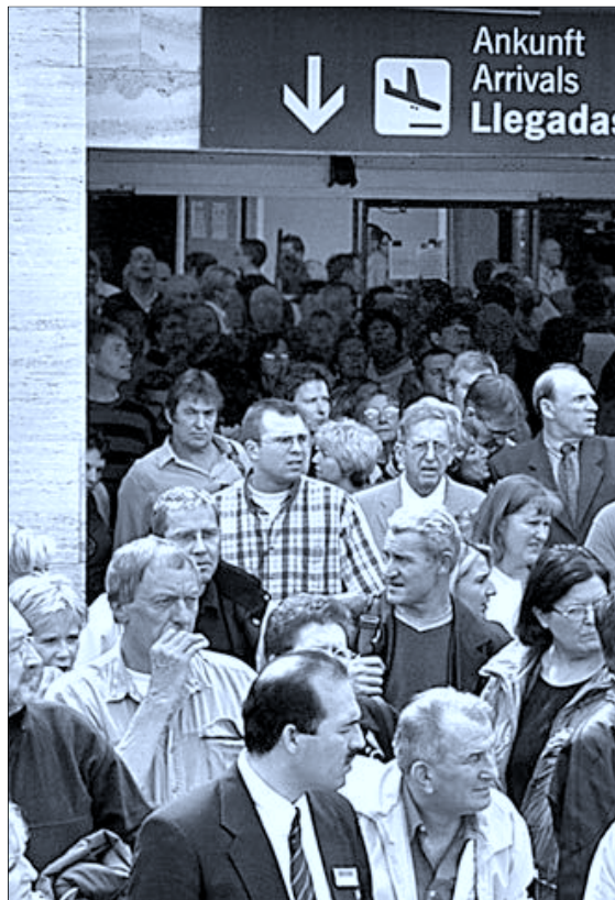
TURISTAS EXTRANJEROS tras su llegada al aeropuerto Reina Sofía.