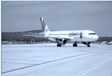
UN AVIÓN de la compañía Orbest, del grupo Orizonia.

El mercado italiano, el irlandés y el portugués experimentaron un comportamiento positivo en Canarias, mientras que los datos de Grecia, que nunca ha aportado una cantidad de turistas relevante a las Islas, tampoco mostraron diferencias con los de años precedentes y sus pobres números, se asocian casi en exclusiva, a unas pocas decenas de turistas que recalaron entre el 25 de abril y el 30 de junio dentro del fallido programa de Turismo Senior europeo, que el Ejecutivo autonómico rehusó retomar para este curso. De hecho, estas cifras ni siquiera tienen reflejo en las estadísticas de Aeropuertos Españoles y Navegación Aérea (Aena), las de Turismo de