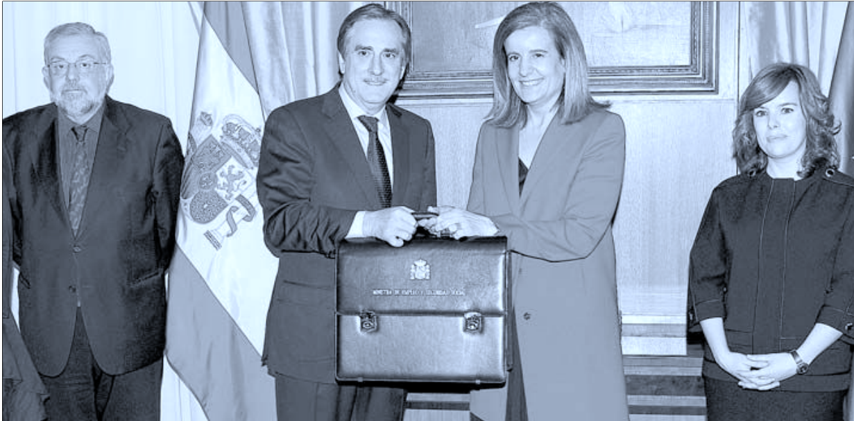
La ministra de Empleo, Fátima Báñez, recibe el traspaso de la cartera de manos de su predecesor, en presencia de Octavio Granados y Soraya Sáenz de Santamaría.

Toxo pide una reunión ya con el Gobierno y prorrogar en febrero la paga de 400 euros