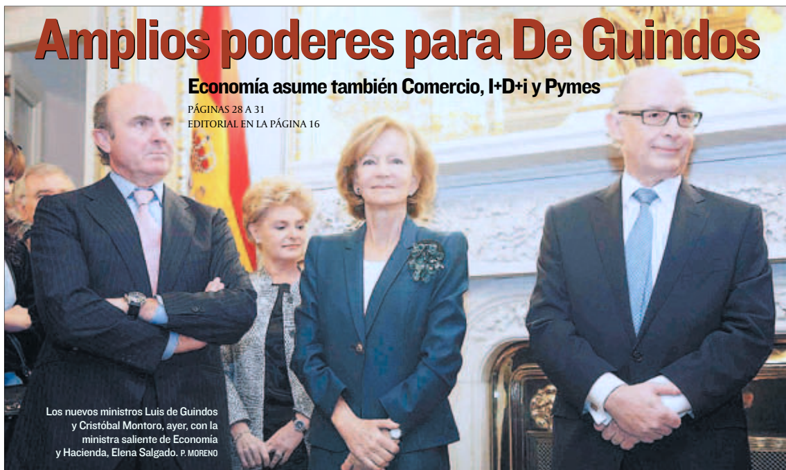
Los nuevos ministros Luis de Guindos y Cristóbal Montoro, ayer, con la ministra saliente de Economía y Hacienda, Elena Salgado.

PÁGINAS 28 A 31 EDITORIAL EN LA PÁGINA 16