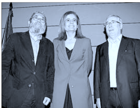
Fátima Báñez, entre Cándido Méndez e Ignacio Fernández Toxo.

Se suavizan así ligeramente los mensajes del PP hacia sindicatos y empresarios mostrados hasta ahora. Tras la reunión celebrada el 30 de noviembre entre el presidente del Gobierno, Mariano Rajoy, y el presidente de la patronal y los líderes sindicales, la secretaria general del PP, María Dolores de Cospedal, anunció que se había dado de plazo a los agentes sociales hasta después de Reyes para que enviaran propuestas sobre seis aspectos del mercado laboral: contratación, arbitraje, formación, negociación colec-