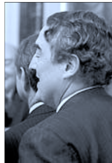
Juan Rosell.