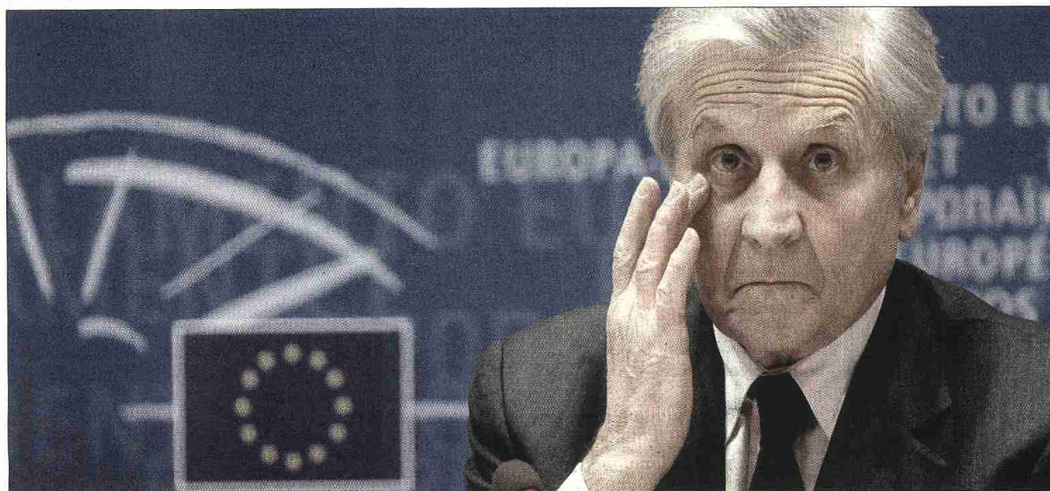
¡JO! Jean-Claude Trichet considera que los bancos tienen que trasladar con más intensidad a las familias la rebaja de tipos de interés.

Los precios de los alimentos caerán un 23% a nivel mundial en 2009 frente a la media registrada este año, y el barril de petróleo rondará los 75 dólares, según el Banco Mundial.