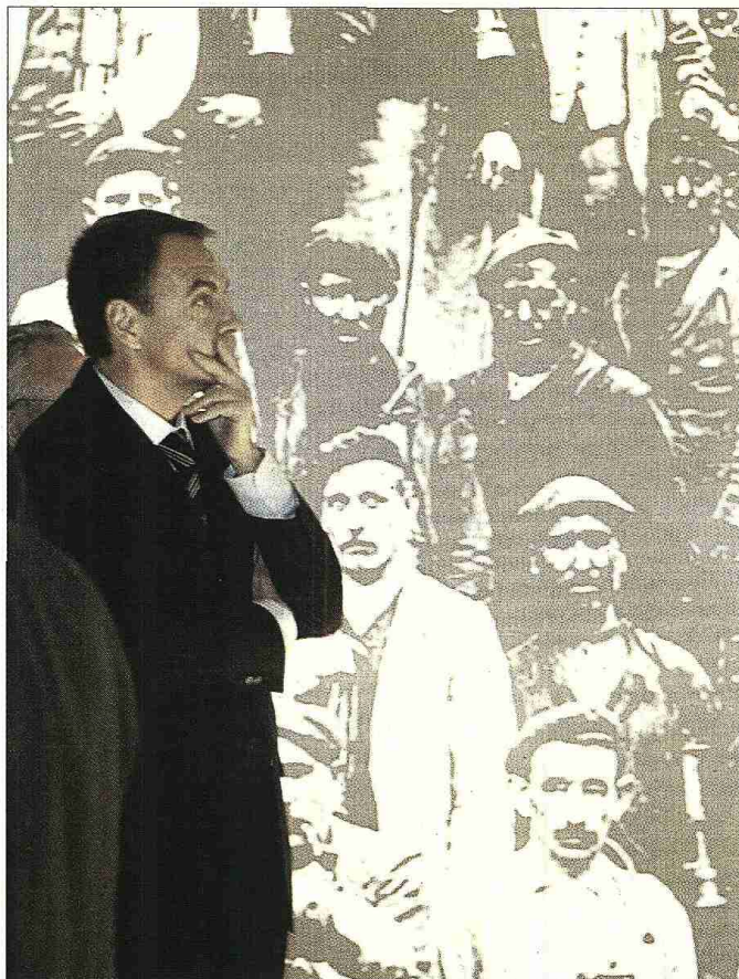
SEGURIDAD SOCIAL. Zapatero, ayer, en la exposición 'Cien años de protección social'.

En este sentido, recordó que la aportación del Estado para mejorar las prestaciones de menores ingresos es de 7.500 millones, algo que calificó de "formidable ejercicio de solidaridad".