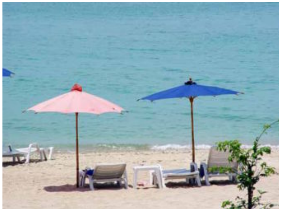
Hasta octubre, las pernoctaciones en establecimientos hoteleros descendieron un 7,1% interanual.

mismo periodo del año anterior. Y, no sólo se debe a que la demanda haya descendido por la recesión generalizada, sino que también los turistas internacionales han preferido pasar sus vacaciones en otros países mediterráneos, como Turquía, Túnez y Marruecos, cada vez más competitivos tanto en precio como en calidad. Ade-