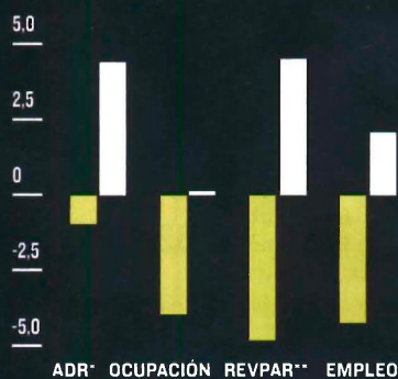
TURISMO ESPAÑOL Variación interanual de junio a septiembre en porcentaje, 2012/2011.

*Tarifa media diaria. **Ingreso medio por habitación disponible.