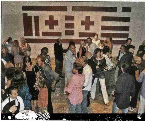
Vista general del patio y del numeroso público.