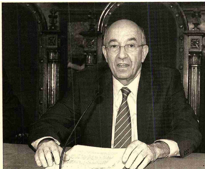
Miguel Ángel Fernández Ordóñez, gobernador del Banco de España.

Una señal de alarma que los resultados de la balanza por cuenta corriente, acumulados hasta mayo, no sólo confirman sino que empeoran. Así, el descenso del 4,5% en el superávit de la balanza de servicios se ha convertido en un nuevo factor añadido -junto a los empeoramientos tradicionales en las rúbricas del comercio, rentas y, últimamente, también en transferencias corrientes- para el crecimiento de nuestro déficit por cuenta corriente, que volvió a crecer un 20%, hasta 42.519,3 millones de euros, en el periodo.