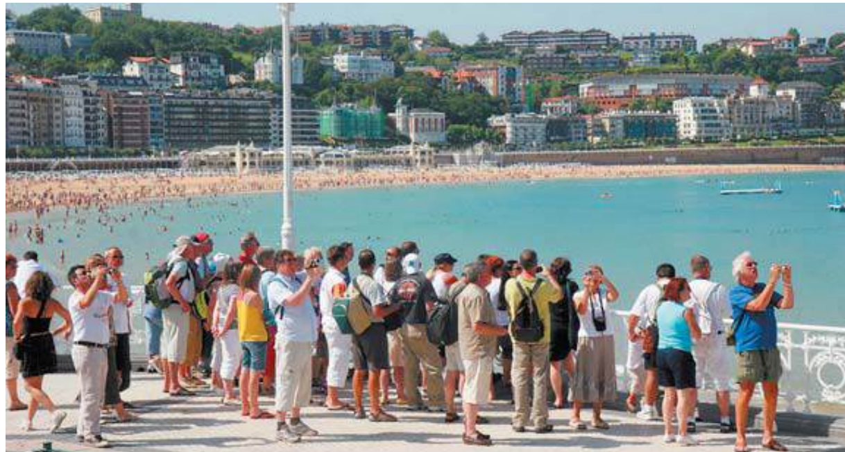
LA COSTA, DESTINO PREFERIDO. Un grupo de turistas en la bahía de La Concha. La costa está resistiendo mejor a la crisis.