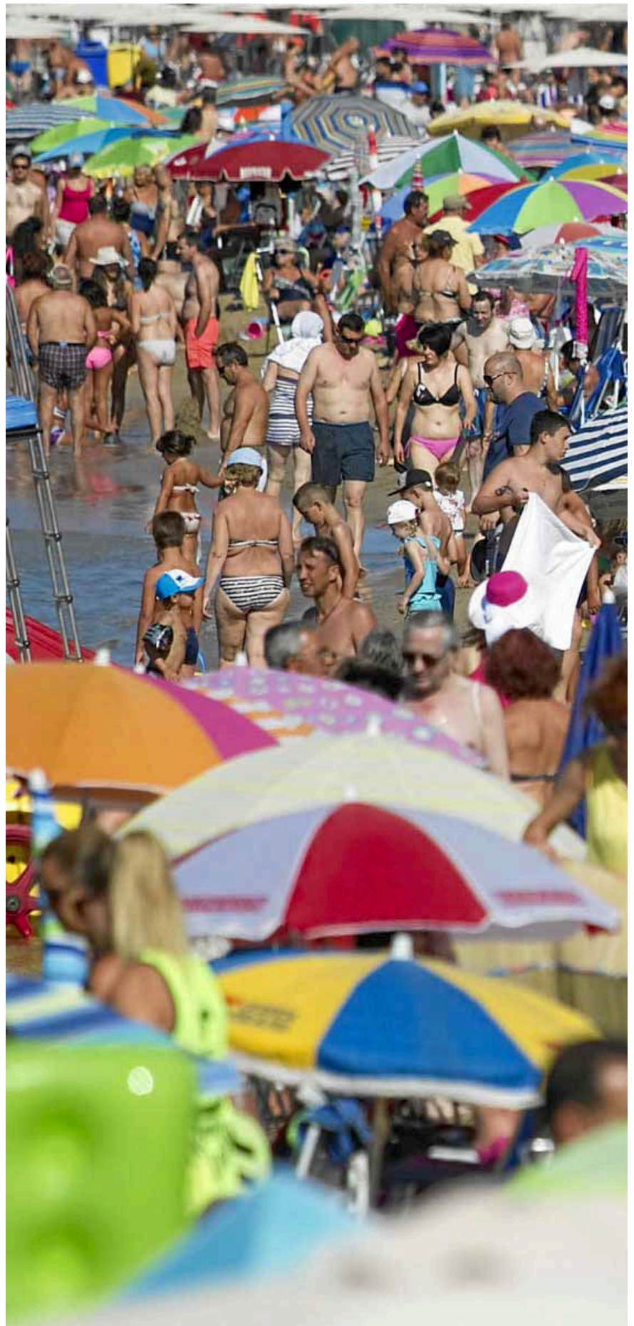
Imagen de Salou del 15 de agosto. Unos 20.000 aragoneses coparon este destino durante el puente. JOSÉ CARLOS LEÓN

Otro de los objetivos del sector es recuperar el turismo nacional, que supone el 50% de la actividad y que durante los años de crisis se desplomó. Los últimos datos apuntan a una mejoría de alrededor del 5%, aunque el número de pernотaciones hasta mayo (42,4 millones) todavía se encuentran por debajo de las registradas en