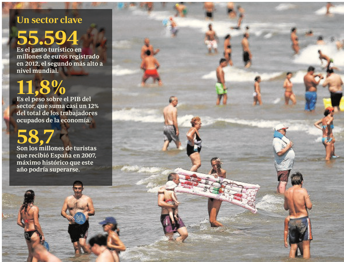
El sol y playa sigue representando el activo más importante de nuestro sector turístico

Son los millones de turistas que recibió España en 2007, máximo histórico que este año podría superarse.