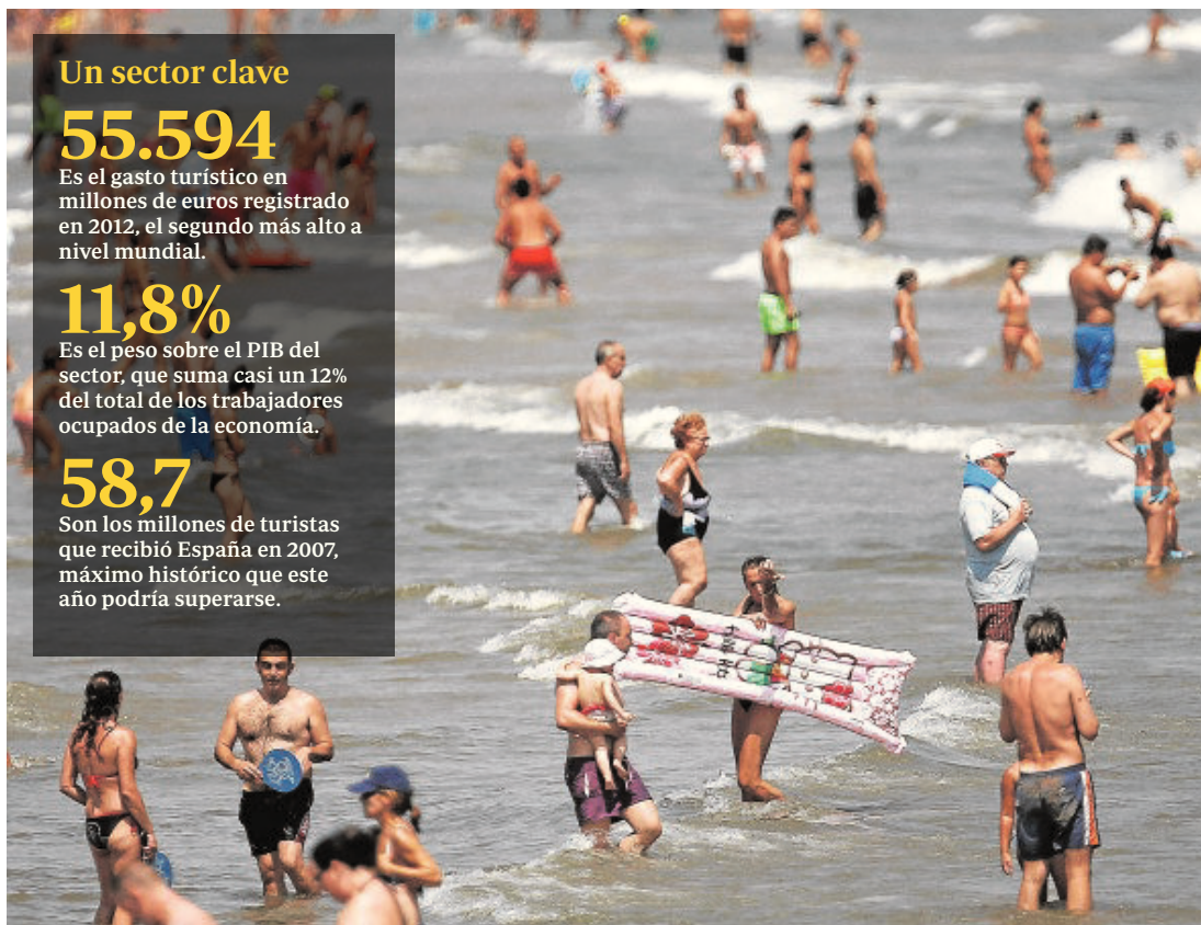
El sol y playa sigue representando el activo más importante de nuestro sector turístico

Son los millones de turistas que recibió España en 2007, máximo histórico que este año podría superarse.