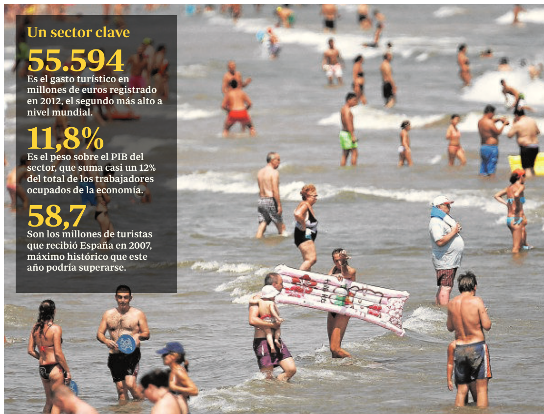
El sol y playa sigue representando el activo más importante de nuestro sector turístico

Son los millones de turistas que recibió España en 2007, máximo histórico que este año podría superarse.