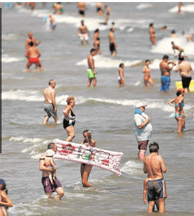
El sol y playa sigue representando el activo más importante de nuestro sector turístico