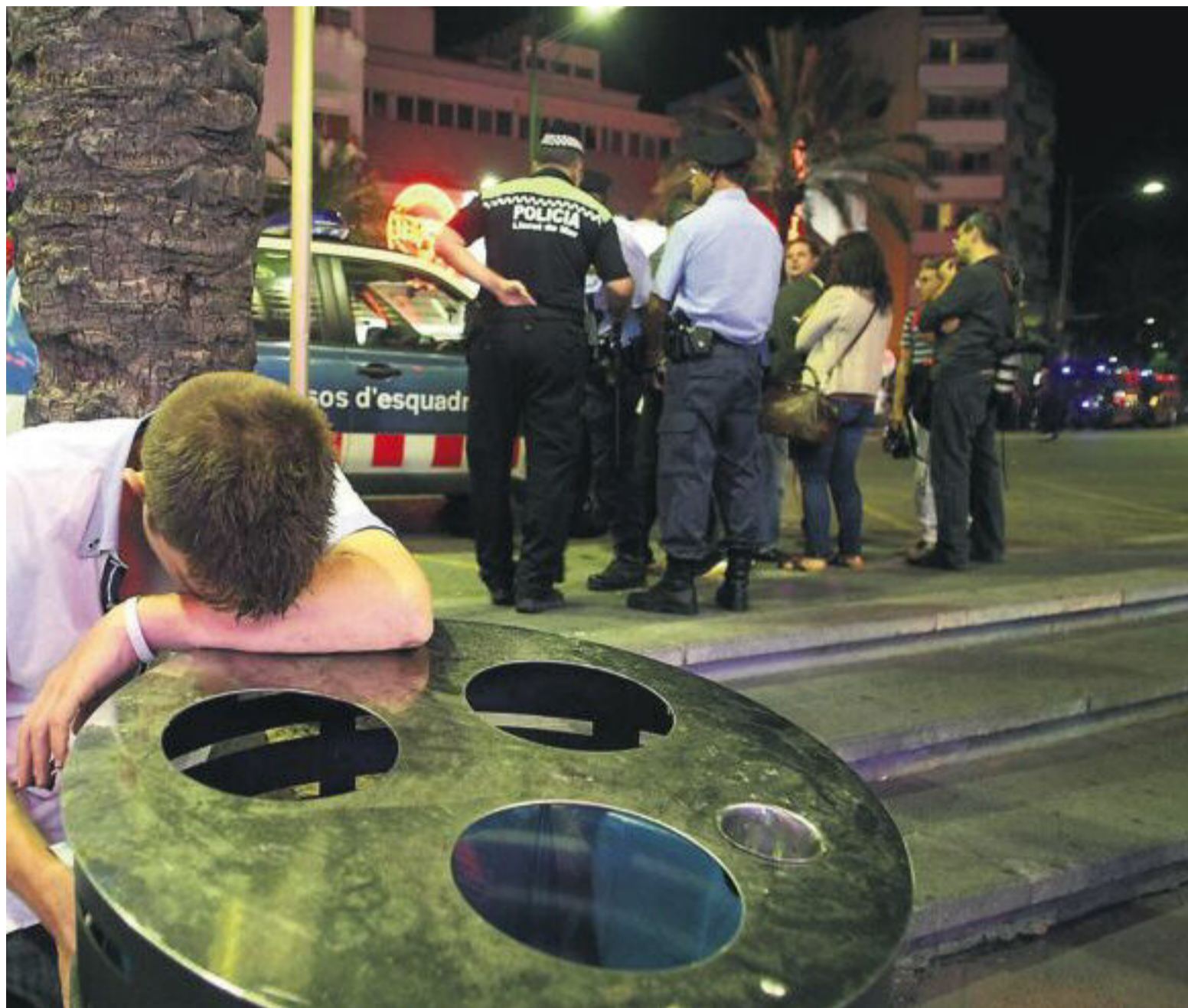
Ambiente nocturno en la zona de La Rivera, en Lloret de Mar (Girona), en la noche del 11 al 12 de agosto.

entender, los altercados son puntuales y se pueden solucionar con más policía. La pasada madrugada, los Mossos d'Esquadra blindaron la ciudad y garantizaron una noche segura. Sabrià propone además alejar los bares y discotecas del centro del municipio, pero Fecasarm, la patronal del ocio nocturno en Cataluña, se niega.