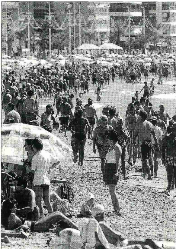
España recibió en julio la visita de 7,1 millones de turistas extranjeros.

La afluencia de turistas internacionales hacia Balears descendió un 2,2 por ciento en julio, encabezando esa disminución los alemanes, con un 3,6 por ciento menos que en el mismo mes de 2007, seguidos por los británicos, cuya presencia se redujo en un 2,6 por ciento, a pesar de lo cual, la Comunidad se mantuvo en segundo lugar entre las más visitadas, aglutinando el 23,7 %.